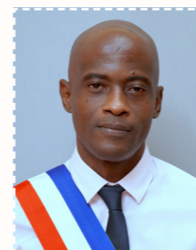
Teddy CLIO Sécurité - Prévention