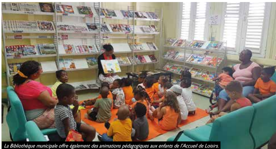
La Bibliothèque municipale offre également des animations pédagogiques aux enfants de l'Accueil de Loisirs.

Tous ont déjà promis de faire encore mieux pour la nouvelle saison et de porter haut les couleurs de la Ville.