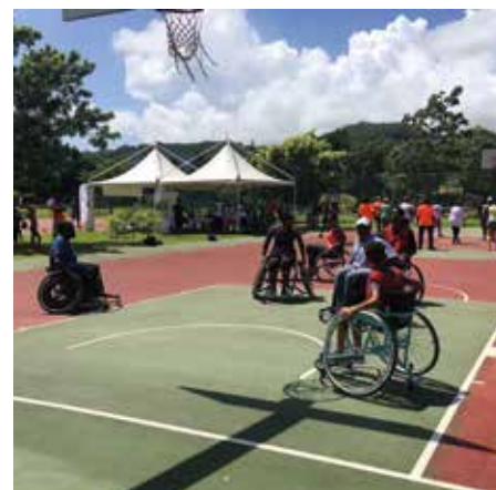
Cette opération a permis de sensibiliser le public aux bienfaits du sport pour la santé.

Le Grand village santé et bien-être a accueilli les visiteurs à l'Espace Filia. Sur les stands animés par des professionnels le public a pu faire des tests santé, des mesures du souffle et obtenir des conseils d'hygiène de vie, nutrition et santé. En tenue sport ou de ville ils ont participé à des séances de Gym tendance, Zumba, Kuduro fit, etc. Pour se détendre, ateliers massage et respiration étaient proposés. Les plus jeunes ont participé à des activités sportives et animations ludiques.