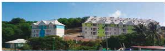
Résidence Les Palétuiviers

La SIMAR, gère 11 800 logements répartis sur 31 communes et compte aujourd'hui 3 agences et 7 antennes décentralisées.