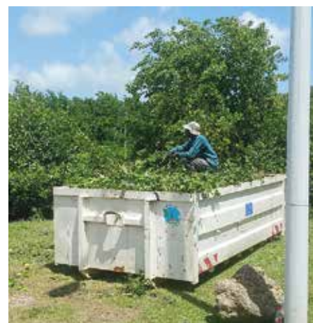
Les bennes des Services Techniques permettent le ramassage en grand nombre de déchets acheminés vers des filières d'élimination.

L'opération se déroule en cinq étapes. Le samedi matin plusieurs habitants se sont retrouvés devant le foyer rural vers le ponton de Presqu'île. Munis d'outils de nettoyage et de jardinage ils ont élagué, enlevé des déchets, nettoyé des sites. Les déchets ont été enlevés par la Brigade de l'environnement à l'aide de bennes des services techniques. L'opération s'est clôturée début décembre par un dernier coup de main à Presqu'île suivi d'un bilan et d'un bon déjeuner. Cette année, une sensibilisation à la protection de l'environnement est prévue par les organisateurs. Depuis ce nettoyage, la fréquentation de Presqu'île par le public aurait augmentée.