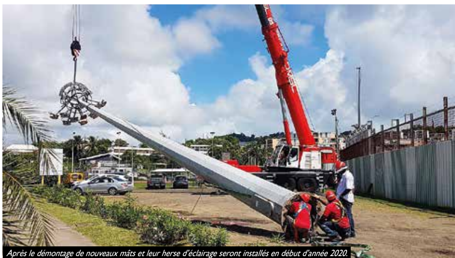
Après le démontage de nouveaux mâts et leur herse d'éclairage seront installés en début d'année 2020.

En janvier une étude d'éclairage permettra de finaliser la luminosité sur le terrain avec 70 points de vérification. L'opération de levage et de dépose a été similaire sur les quatre pylônes entourant le stade. Cette phase de travaux d'éclairage est estimée à plus de 600 000 € financés par l'Etat, l'Europe la FFF, le FTPME, la CAESM et la Ville. Cette première tranche de modernisation du complexe sportif qui comprend l'éclairage, la réfection du hall des sports et la piste d'athlétisme est estimée à plus de 3 millions d'euros. L'éclairage du stade est important pour les associations sportives qui l'attendent avec impatience.