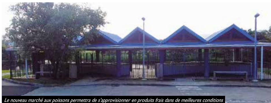
Le nouveau marché aux poissons permettra de s'approvisionner en produits frais dans de meilleures conditions

Le kiosque provisoire où se trouvent actuellement les marins-pêcheurs restera à la disposition de la Ville. Le service développement économique de la Ville organise depuis des réunions avec les marins pêcheurs pour la prise en main de l'équipement. L'installation d'une machine de distribution de glace en paillette est aussi à l'étude par la Mairie.