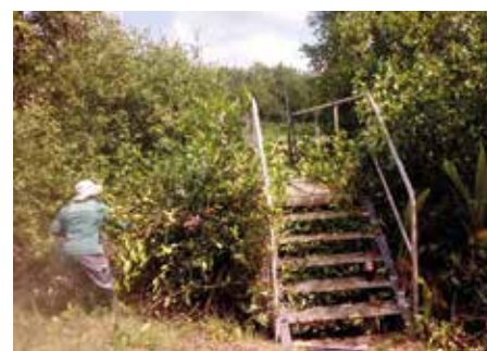
Le nettoyage porte aussi bien sur les débris que sur les déchets végétaux.

Les travaux de nettoyage et d'embellissement des bords du canal d'Eucalyptus ont eu lieu au mois de septembre. L'opération était conduite par la Brigade de l'Environnement de la Ville (ex. Brigade du littoral). Cinq agents étaient mobilisés, la Direction des Services Techniques a mis une benne à leur disposition. L'objectif était de nettoyer les berges du canal pour favoriser l'écoulement des eaux en cas de pluies. Des débris naturels et de nombreux déchets de la main de l'homme ont été enlevés. Cette opération vise à protéger le quartier des crues et à préserver l'environnement.