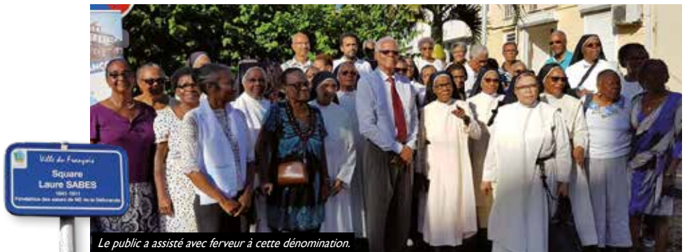
Le public a assisté avec ferveur à cette dénomination.

Elle fonde le 02 février 1868, la congrégation des Filles de Notre Dame de la Délivrande, première congrégation autochtone, accueillant les filles de couleur et dont la mission principale