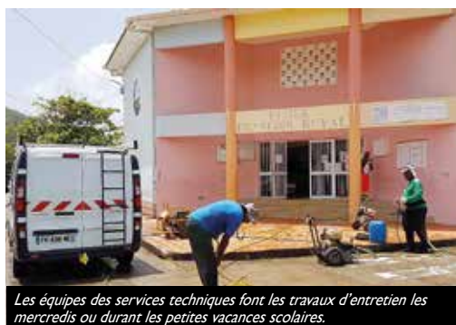
Les équipes des services techniques font les travaux d'entretien les mercredis ou durant les petites vacances scolaires.

Les équipes des services techniques ont profité des vacances de Toussaint pour poursuivre leurs travaux dans les écoles. Les agents de tous les corps de métiers étaient mobilisés dans les écoles pour la peinture, la menuiserie, la charpente, l'électricité, la plomberie et la ferronnerie. On peut retenir les travaux de fermeture de l'escalier de l'école de Bonny, la reprise du bardage du mur du restaurant de l'école Morme Acajou, la réalisation d'un portillon à l'école de Perriolat. La peinture à l'école de Dumaine, le remplacement des climatiseurs de l'école de Bonny, la réalisation d'une chape à l'école de Bois Soldat et la réparation de la cour de l'école François Duval sont aussi à dénombrer. Ces travaux d'entretien des établissements scolaires complètent ceux réalisés pendant les grandes vacances.