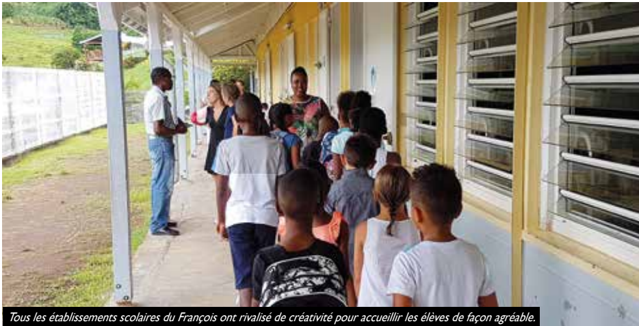
Tous les établissements scolaires du François ont rivalisé de créativité pour accueillir les élèves de façon agréable.