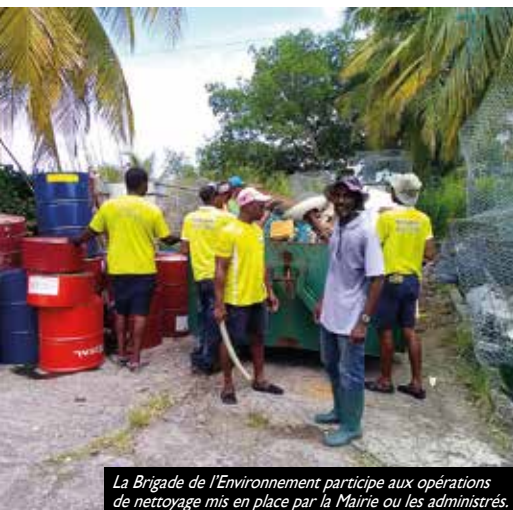
La Brigade de l'Environnement participe aux opérations de nettoyage mis en place par la Mairie ou les administrés.