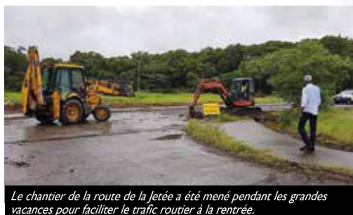
Le chantier de la route de la Jetée a été mené pendant les grandes vacances pour faciliter le trafic routier à la rentrée.

La réalisation de la route reliant la Jetée et la cité scolaire à la route de la liberté s'est achevée cette courant octobre. Les automobilistes, bus scolaires, riverains et élèves peuvent accéder à la sortie sud du centre-ville en toute sécurité. Cet équipement comprend de nouveaux trottoirs, des canalisations pour mieux évacuer les eaux de pluie, et un revêtement goudronné. Des ralentisseurs ont été posés. Ces travaux ont été suivis de près par la Ville même par mauvais temps. Réalisée en moins de trois mois cette nouvelle route est estimée à près de 300 000 €. Les élèves peuvent désormais se rendre au complexe scolaire dans de meilleures conditions.