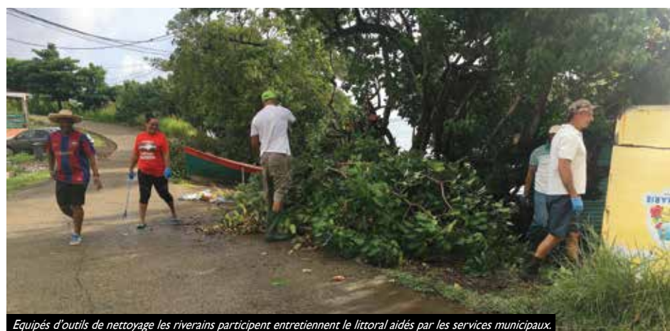
Equipés d'outils de nettoyage les riverains participent à l'entretien du littoral aidés par les services municipaux.