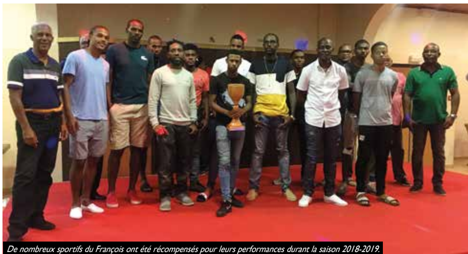
De nombreux sportifs du François ont été récompensés pour leurs performances durant la saison 2018-2019.