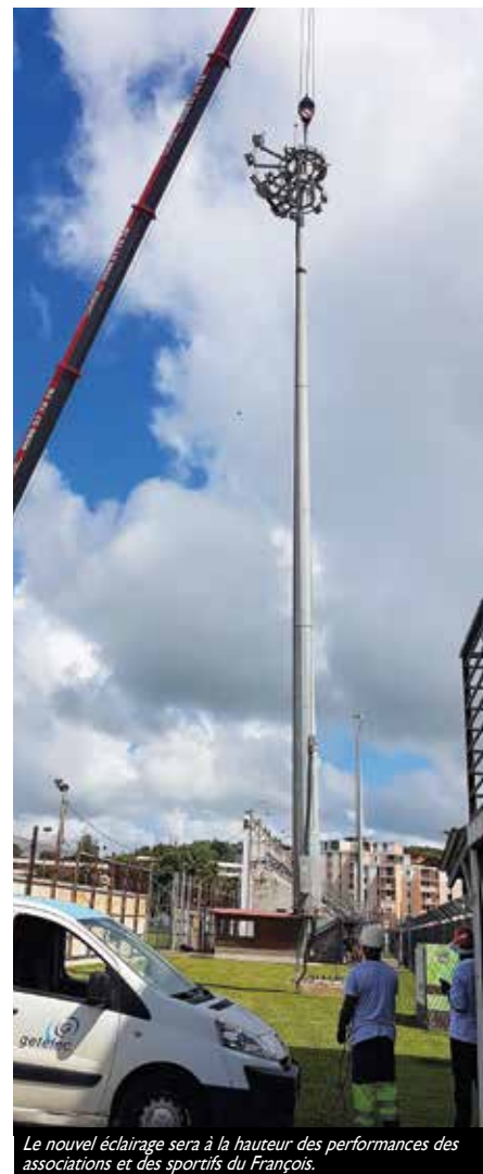
Le nouvel éclairage sera à la hauteur des performances des associations et des sportifs du François.