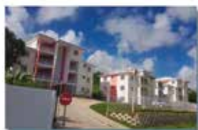
Résidence Les Ramiers

50 logements - Quartier Mansarde Rancée Sud - Le François