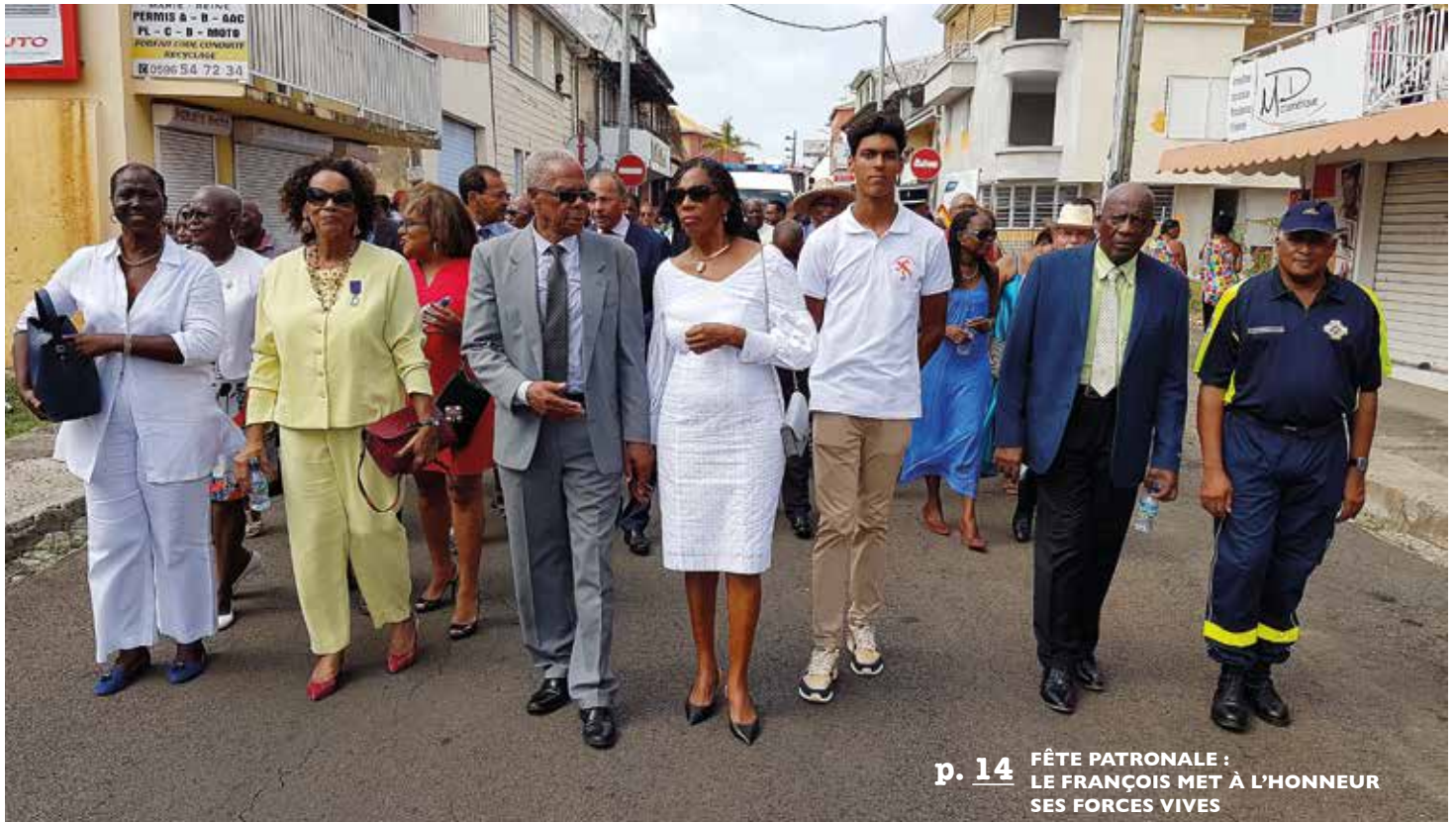
p. 14 FÊTE PATRONALE : LE FRANÇOIS MET À L'HONNEUR SES FORCES VIVES

Directeur de la publication : Joseph Loza Rédactrice en chef : Audrey Saint-Louis Conception Rédaction : Service Communication Ville du François Mise en page, Fabrication : Média Plus Communication Impression : Caraib Ediprint Tirage : 8000 ex. - Gratuit Magazine au format pdf sur : calameo.com/accounts/xxxx