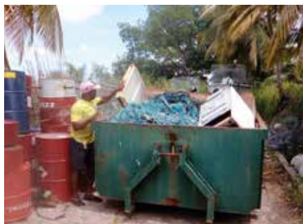
Plusieurs bennes des services techniques ont permis d'enlever des centaines de kilos de déchets;

Cependant, les huiles de moteur usagées n'ont pas pu être récupérées. Une étude est menée pour trouver la meilleure solution pour que ces professionnels de la mer s'en débarrassent.