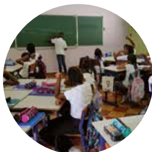
UNE RENTRÉE SCOLAIRE SUR DU VELOURS