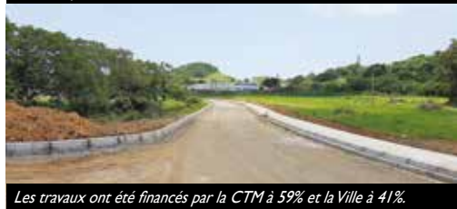
Les travaux ont été financés par la CTM à 59% et la Ville à 41%.