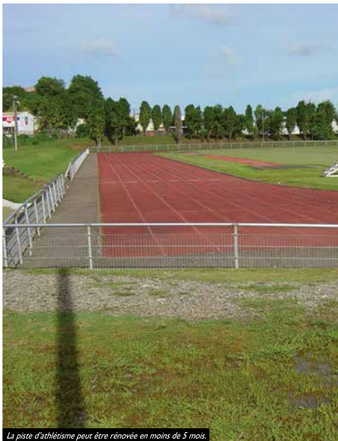
La piste d'athlétisme peut être rénovée en moins de 5 mois.