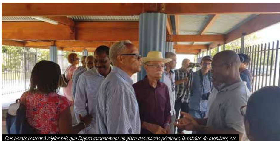
Des points restent à régler tels que l'approvisionnement en glace des marins-pêcheurs, la solidité de mobiliers, etc.