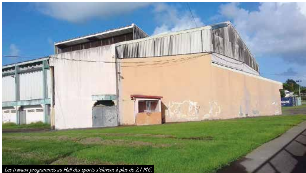
Les travaux programmés au Hall des sports s'élèvent à plus de 2,1 M€.

(*)EPCI : établissement public de coopération intercommunale.